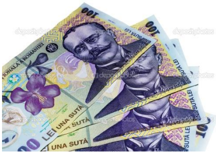
A moeda Romena chama-se LEU