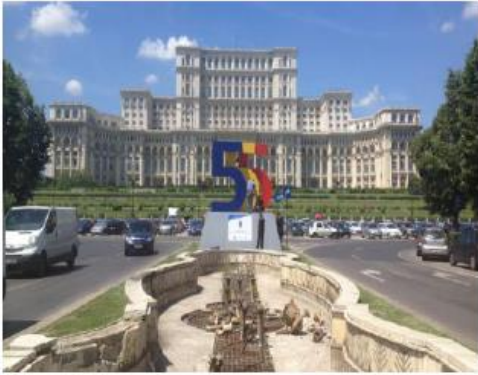
A capital da Roménia é BUCARESTE