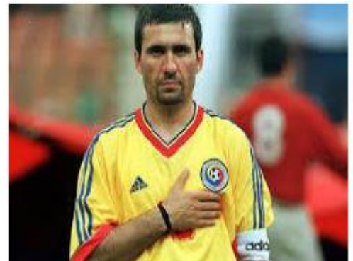
Gheorghe Hagi FUTEBOLISTA