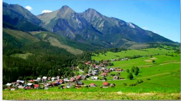
As montanhas da Roménia chamam-se CÁRPATOS