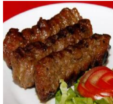
Uma das comidas tradicionais da Roménia é o MICI