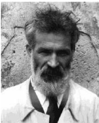
Constantin Brancusi ESCU TOR