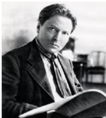
George Enescu MÚSICO